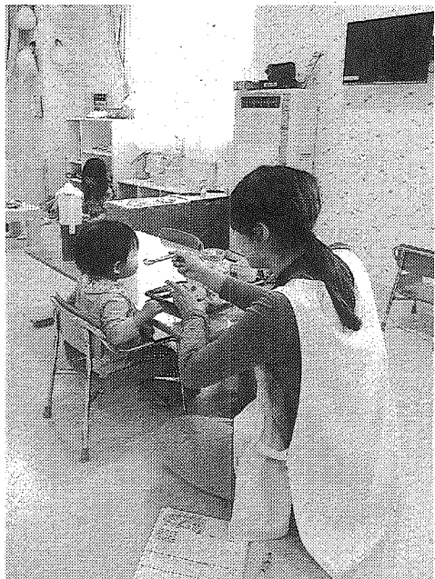
東京都内の病児保育室 (共同)

民主党では本命候補のヒラリー・クリントン前国務長官(68)がバニー・サンダース上院議員(74)に苦戦し始めた。ルビオ氏が本選まで勝ち残った場合、クリントン氏が相手なら勝つという世論調査予測も出ている。 (ジャーナリスト 高杉 昭一郎)